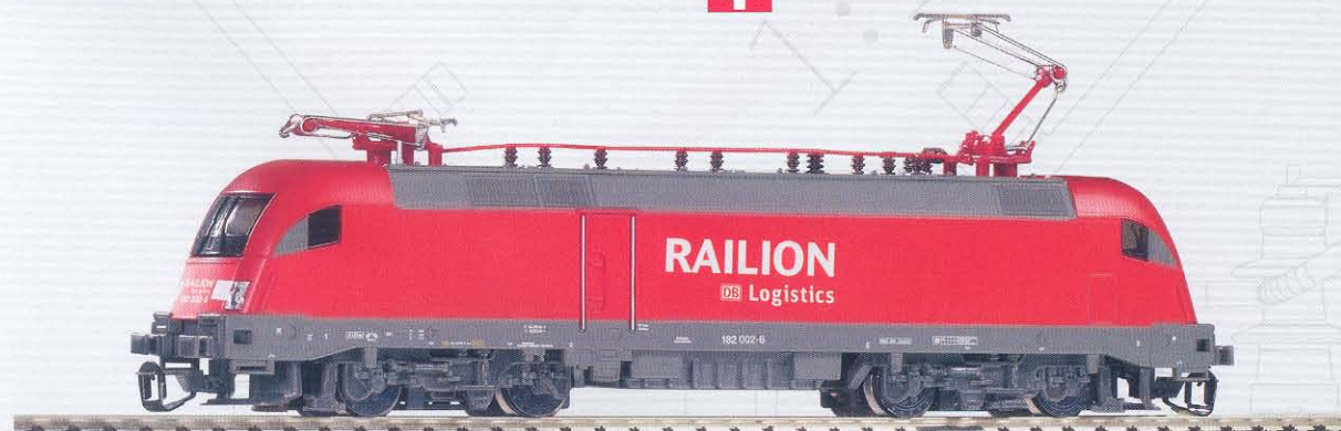
47421 Elektrolok BR 182 Railion-Logistics Ep. V