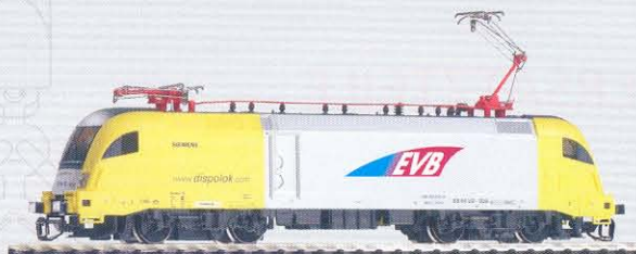
47417 Elektrolok Taurus ES 64 U2-038 „EVb-Eisenbahn und Verkehrsbetriebe Elbe-Weser GmbH“ Ep. V