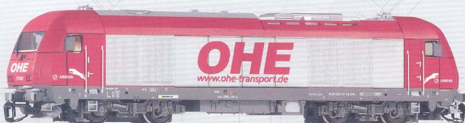
47589 Diesellok Herkules 270 080 „OHE“ Ep. V