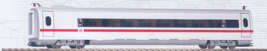
47691 ICE 3 Sitzwagen 2. Kl. DB AG Ep. V