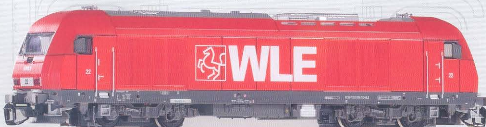
47590 Diesellok Herkules „Westfälische Landes-Eisenbahn GmbH“ Ep. V