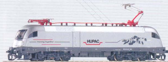
47419 Elektrolok Taurus „Hupac“ Ep. V