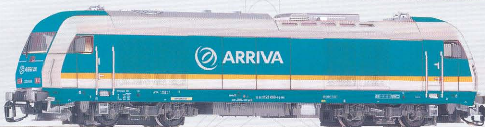
47585 Diesellok Herkules 223 ARRIVA Ep. V

Die Seiten der Lok sind wie im Original unterschiedlich bedruckt.