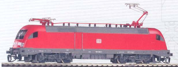
47410 Elektrolok BR 182 DB AG Ep. V 59,99 €*