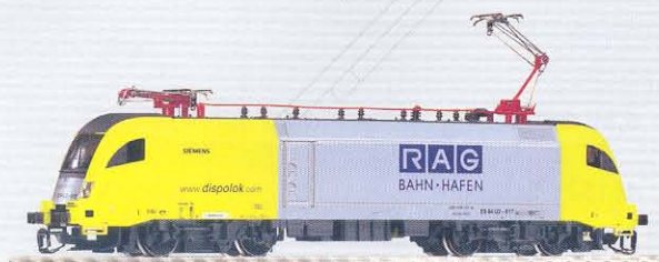
47418 Elektrolok Taurus ES 64 U2-017 „RAG“ Ep. V