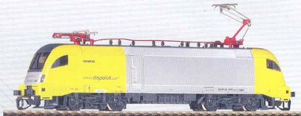
47411 Siemens Dispolok ES 64 U2 Ep. V 59,99 €*