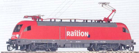
47412 Elektrolok BR 182 „Railion“ Ep. V 59,99 €*