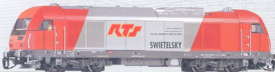
47586 Diesellok Hercules 2016 905 „RTŚ“ Ep. V