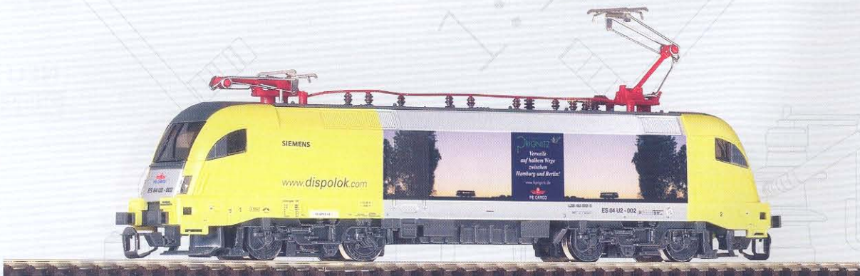
47414 Elektrolok Taurus ES 64 U2-002 „PEG-Prignitzer Eisenbahn GmbH“ Ep. V 59,99 €*