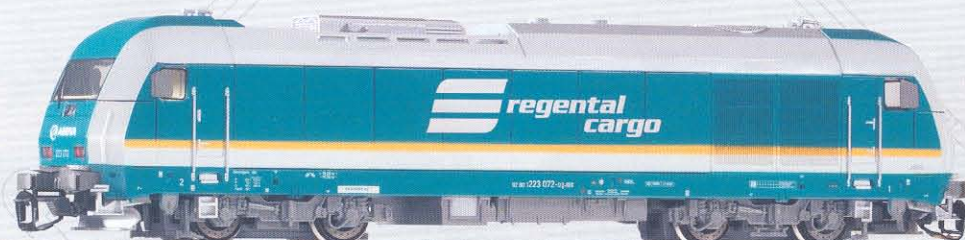
47588 Diesellok Herkules „Regental Cargo“ Ep. VI