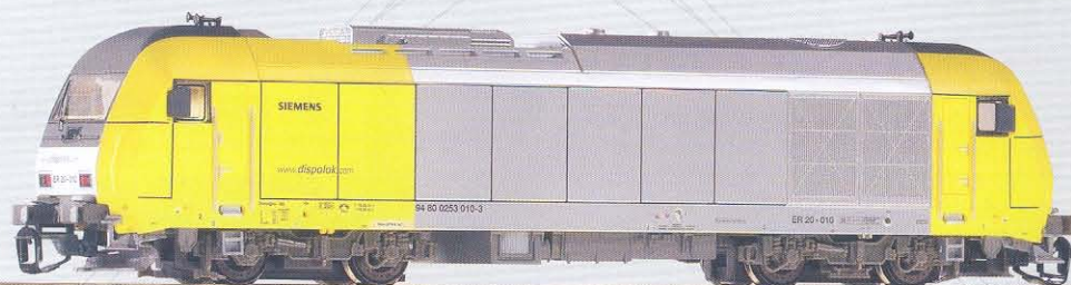
47581 Diesellok ER20 „Siemens Dispolok“ Ep. V