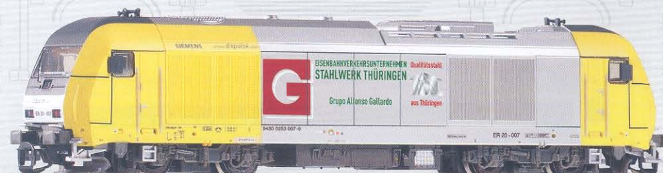
47587 Diesellok Hercules ER20-007 „Stahl aus Thüringen“ Ep. V