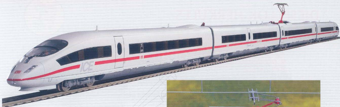
47005 ICE 3 DB AG Ep. V 119,99 €*