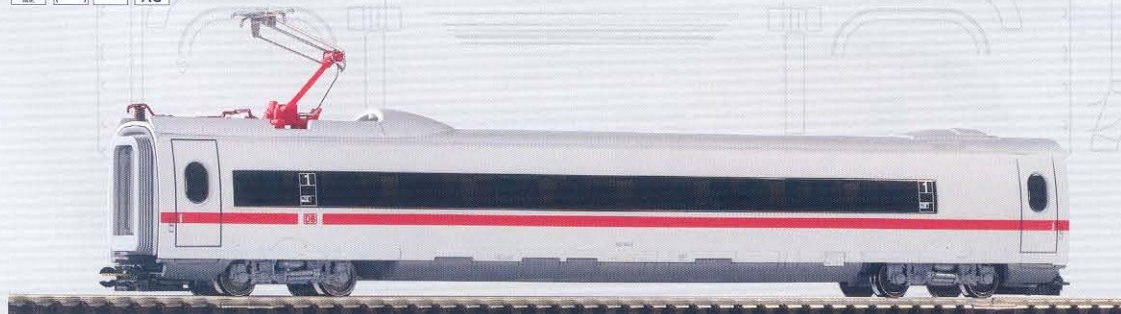
47690 ICE 3 Sitzwagen 1. Kl. DB AG Ep. V mit Stromabnehmer