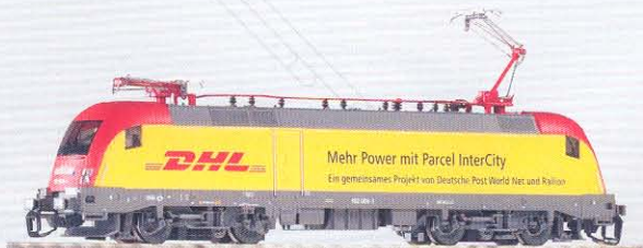
47413 Elektrolok BR 182 Railion „DHL“ Ep. V 59,99 €*