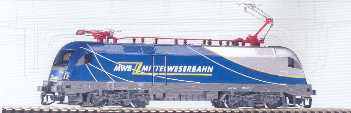
47415 Elektrolok Taurus „MWB - Mittelweserbahn“ Ep. V 59,99 €*