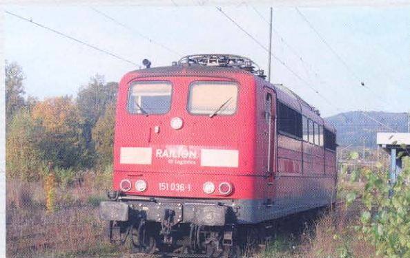
47200 Elektrolok BR 151 DB AG Ep. V mit Einholm-Stromabnehmer