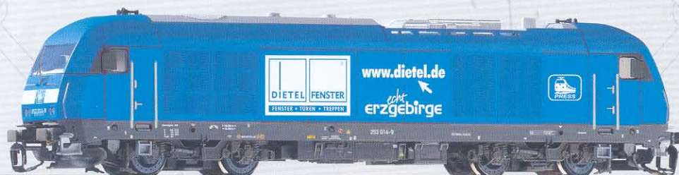
47583 Diesellok Hercules 253 014-9 „Pressnitztalbahn“ Ep. V