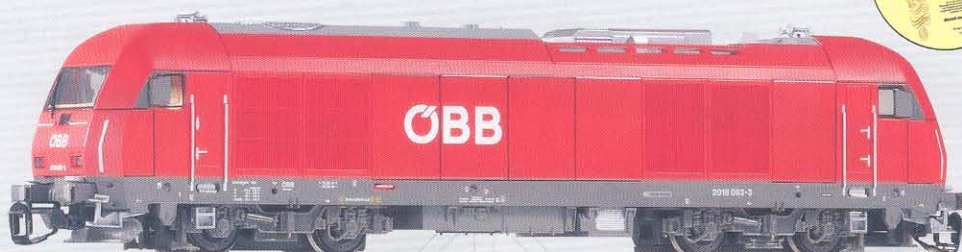
47580 Diesellok Hercules Rh2016 ÖBB Ep. V